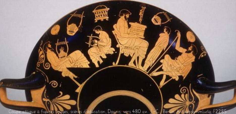
Coupe attique à figures rouges, scènes d'éducation, Douris, vers 480 av. J.-C. Berlin, Antikensammlung, F2285