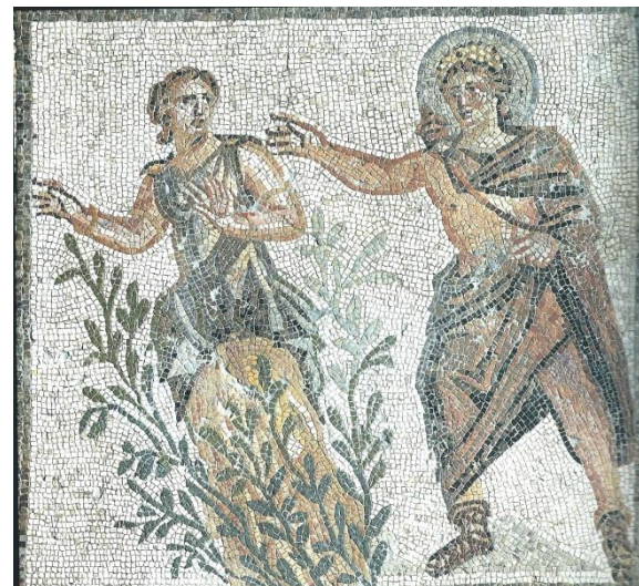
Mosaïque d'Apollon et Daphné. Maison de Ménandre