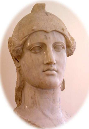
Athéna dite « de la Phryx » Musée archéologique d'Athènes [n°3718].